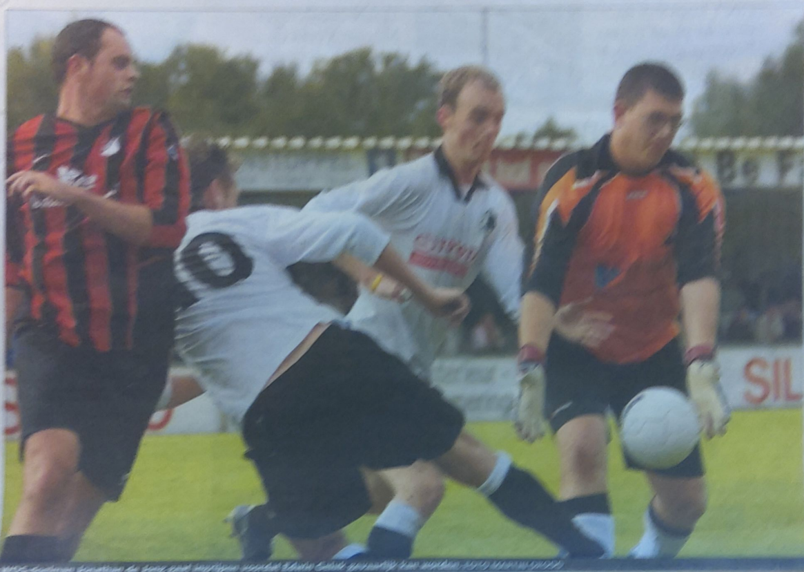
WDS-voetballer zoekt naar de weg naar het veld van de eerste klasse van zaterdag van zaterdag 2010 (HILVERSUMER)