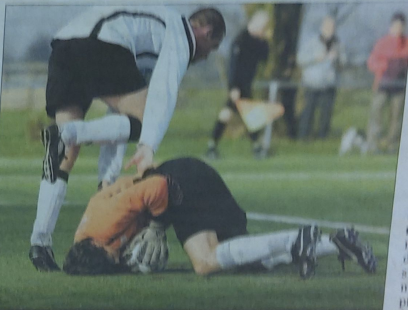
WDS wist zaterdag de doelman van RCL niet te passeren.

Na de 0-3 en even later het slotsignaal trok het ontvreden publiek terug naar de warmte van de kantine, daar waar boven de deur van de bestuurskamer een T-shirt hangt, gemaakt naar aanleiding van het kampioenschap een jaar terug in de derde klasse. Nieuwe hoop?