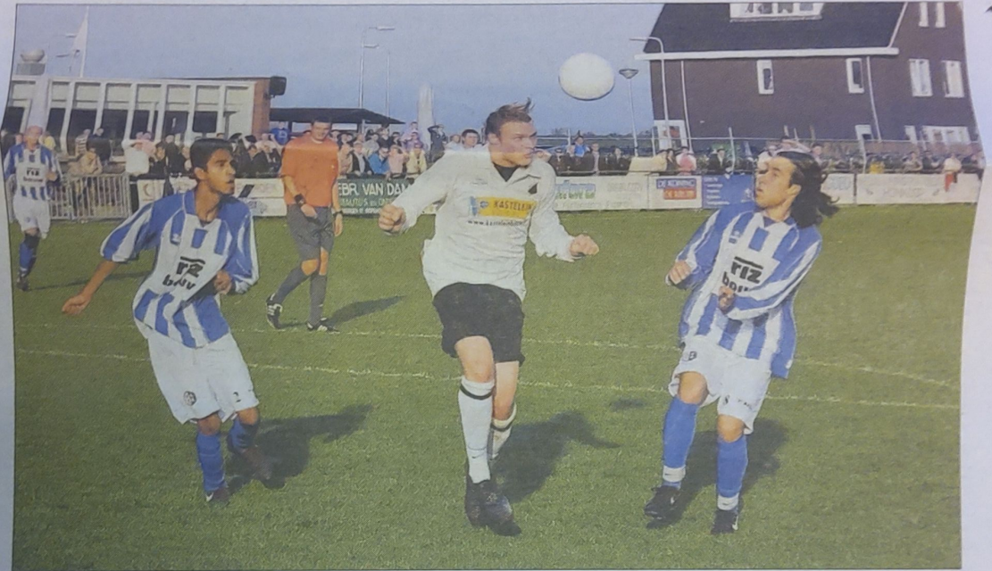
WDS (wit/zwart) zoekt de aanval tegen Schoonhoven.